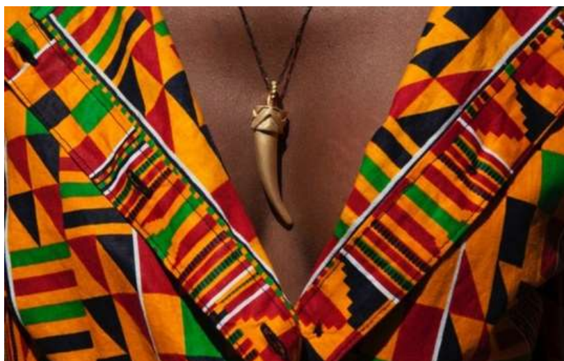
Dente com banho de ouro, da coleção África