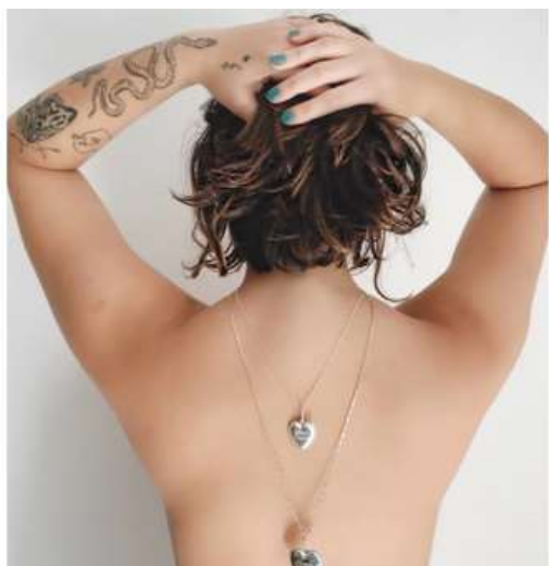
Longos cordões com pingentes de corações de prata, da coleção Eternos

Viajar para a África do Sul garante impressões e imagens que lotam a memória dos smartphones. Para Carla Barros, a coisa foi mais adiante: paisagens, animais, texturas e o pôr do sol viraram braceletes, pingentes em forma de cheetah, cordões com dentes, anéis com tramas de palhas na coleção África. Um sucesso!