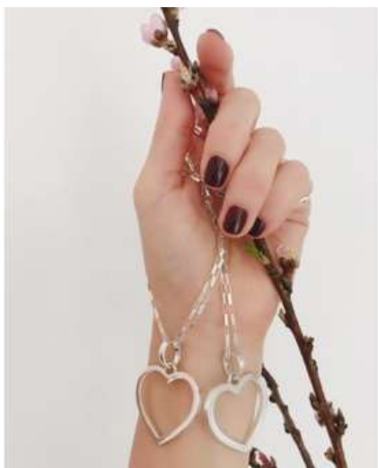
Cordões de elos retangulares com pingentes de corações vazados

Se no lançamento atual, as peças artesanais têm design marcante e primitivo, na anterior, Eternos, ela mostrou que domina também o luxo em formas femininas e românticas. A série, que virou permanente em seu trabalho, envolve a mulher com temas de amor expressos em pingentes de coração, mandalas, longos cordões, que ela sugere usar virados para as costas, valorizando os decotes.