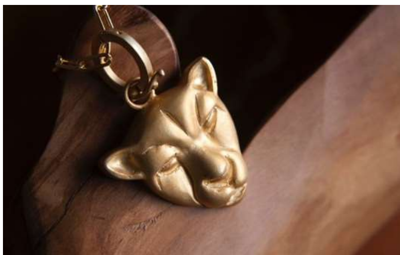
Pingente de cheetah, inspiração africana